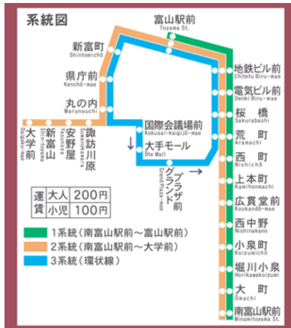
(富山市内軌道線路線図)

バス ;運行頻度が少ないため、市内電車をお勧めします。富山地鉄・路線バス、富山大学經由に乗車し、「富山大学前駅」バス停にて下車してください。所要時間は約 20 分。バス乗り場 (③番) については前ページのマップを参照してください。路線バスの時刻表についてはホームページを参考にしてください。(http://www.chitetsu.co.jp/bus_a/index.html)